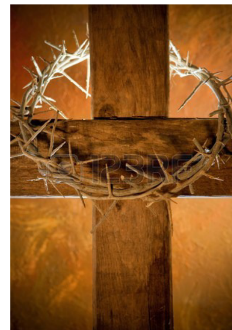
Basilika Lichen, Polen