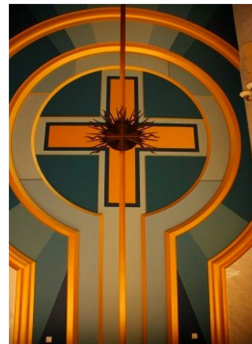
Basilika Lichen, Polen

Reisegebet anschließend Abschied und Abreise