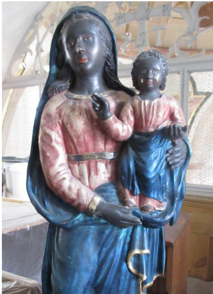
Schwarze Madonna von Loreto