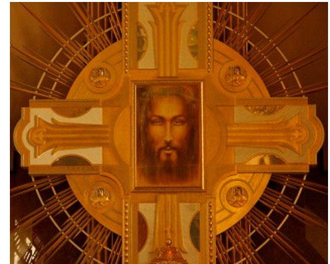
Basilika Lichen (Polen)